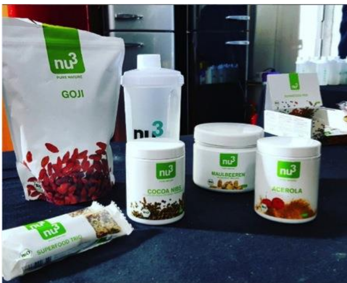
Les produits nu3 dans les coulisses de Ninja Warrior

Parmi ces produits, les participants ont également retrouvé la gamme nu3 dédiée au sport, permettant de booster naturellement les compétences sportives.